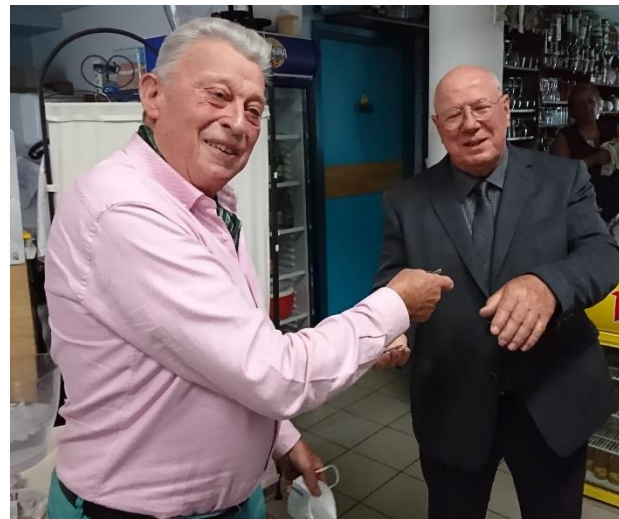
Passation des clés de la Mairie.