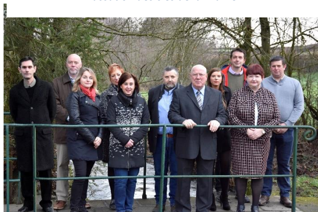
L'équipe municipale à votre service.