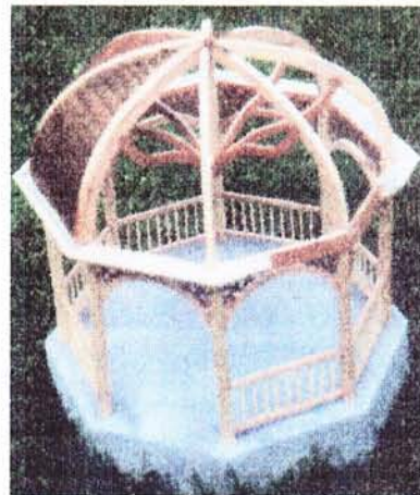
Une ossature en bois, une couverture en cuivre et laiton alternés pour l'esthétique