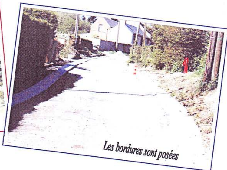
Les bordures sont posées