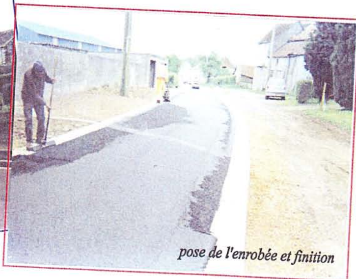
pose de l'enrobée et finition