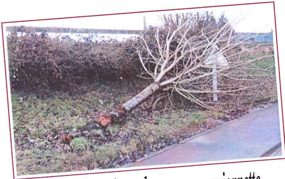
Abattage d'un arbre par une camionnette