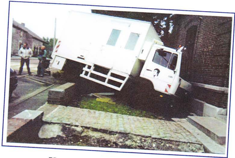
Une visite impromptue à la Mairie