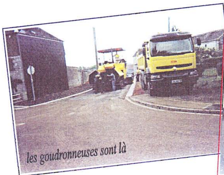
les goudronneuses sont là

Il faut signaler que la réfection des réseaux d'eau et des eaux usées étaient pris en charge par le SIIAN SIDEN