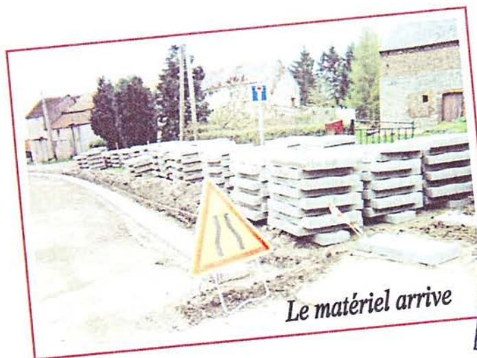
Le matériel arrive