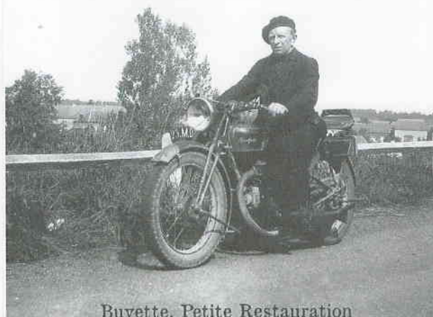
Buvette, Petite Restauration

organisé par l'association La Tenaille et l'association du Musée de la Douane